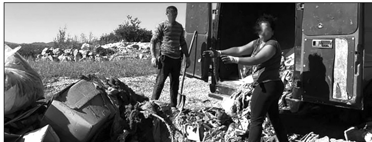
Din acțiunile Poliției Locale pe linie de mediu.

Relații suplimentare se pot obține la numărul de telefon: 0368415162.